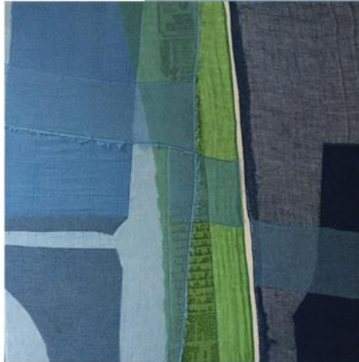
TextilKunst: Ulrike Rüttinger